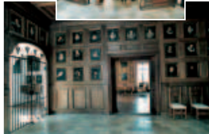
Ahnensaal und Treppe im Fuggerschloss