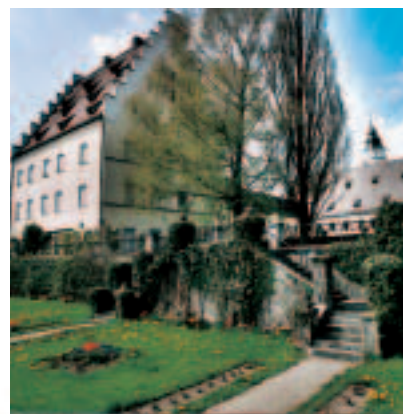
Der prächtige Schlosspark mit seinem historischen Baumbestand lädt ein zum Entspannen und Verweilen.