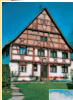
Clemens Maria Hofbauer-Haus

Bei Insidern gilt Babenhausen längst als idealer Ausgangspunkt für Tagesausflüge zu den majestätischen Gipfeln der Allgäuer Alpen, an den Bodensee, die mittelalterlichen Städte Augsburg, Ulm, Memmingen, Kempten und seit jüngster Zeit den Freizeitpark Legoland in Günzburg. Der Markt Babenhausen selbst hat einiges an Kunst und Kultur zu bieten. Herausragend ist das Schloss, der Stammsitz der Fugger, in dem noch heute die Nachkommen der einstmalig reichsten Kaufleute der Welt residieren.